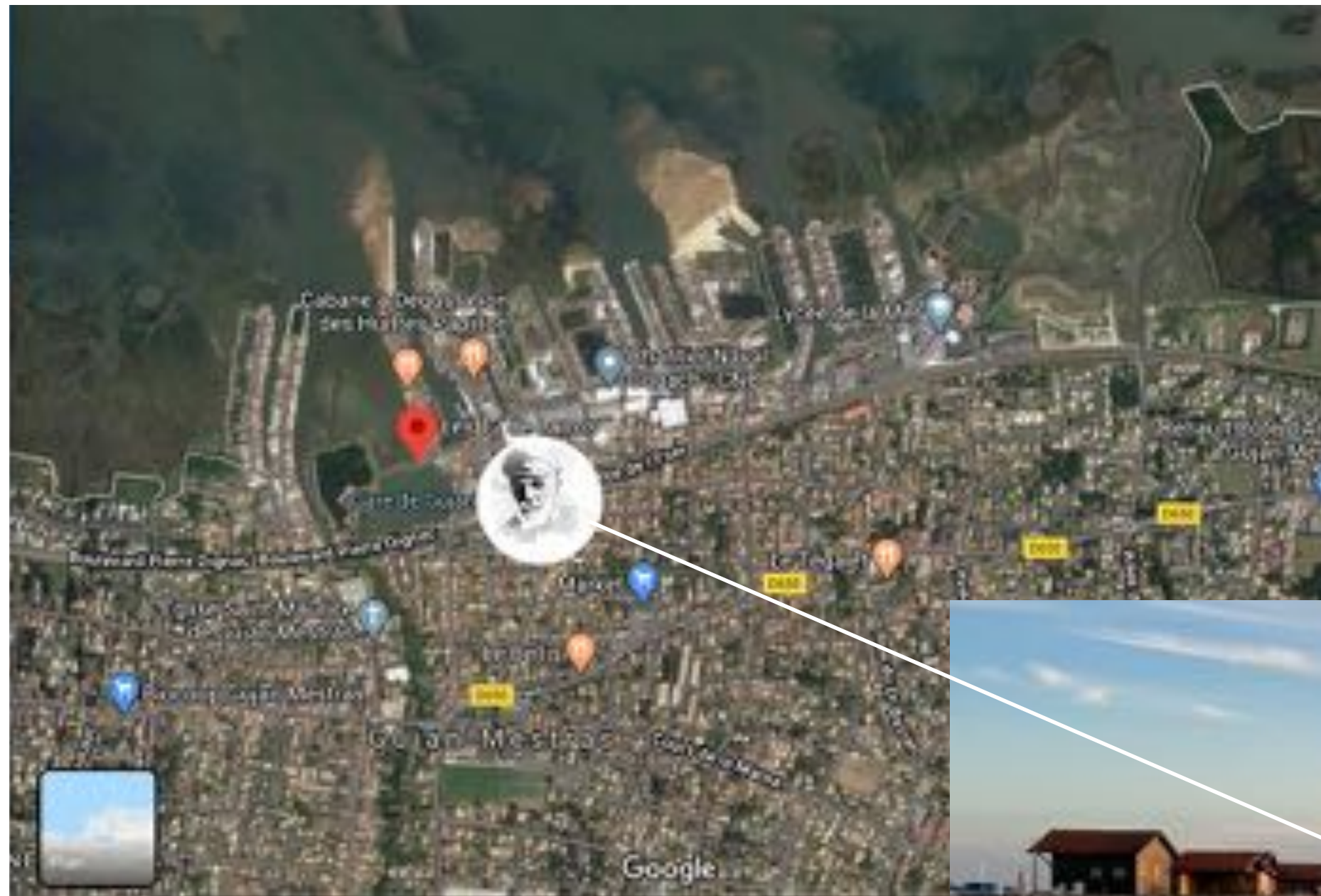
Nord Bassin d'Arcachon