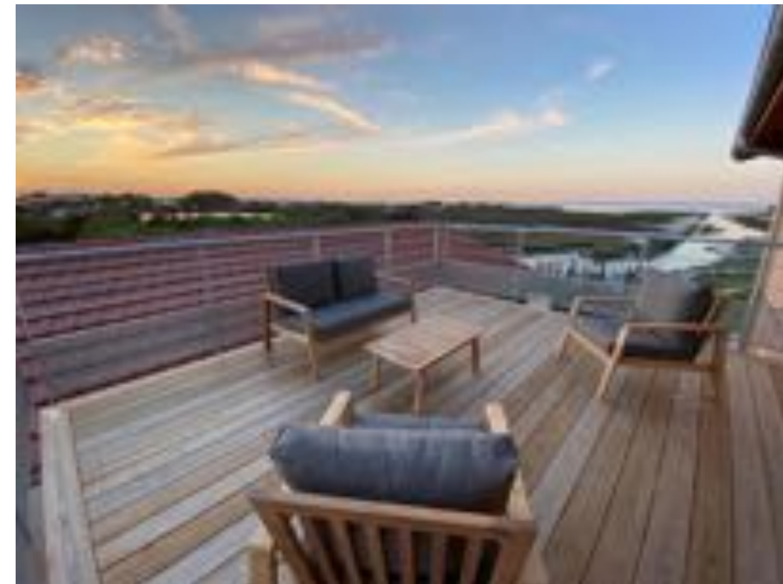
N°12 Vertige de l'Amour - DAVID SELOR 2-4 pers

Nord : Terrasse privative vue bassin d'Arcachon équipée d'une table à manger