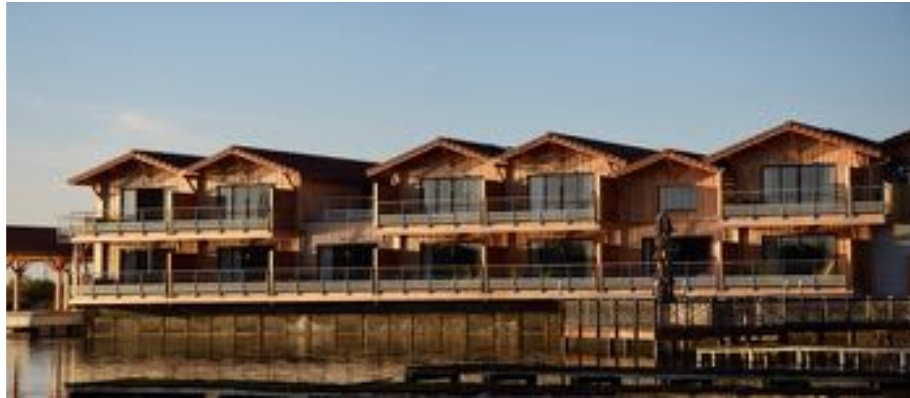
Sud Plan d'eau ostréicole