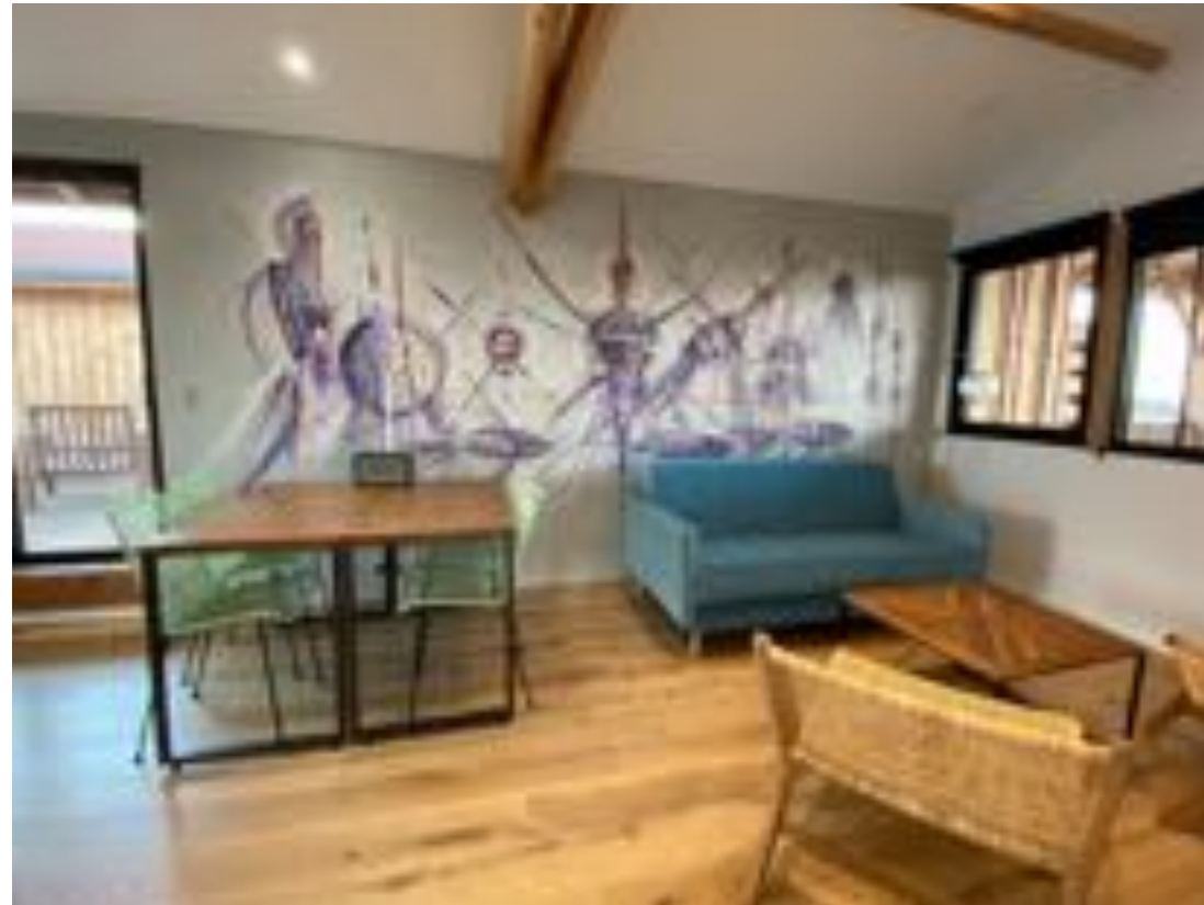
N°10 - L'invitation au voyage - STEPHANE CARRICONDO 2-4 pers

T2 1er étage- 48 mètres carrés env. - Logement traversant 3 terrasses privatives