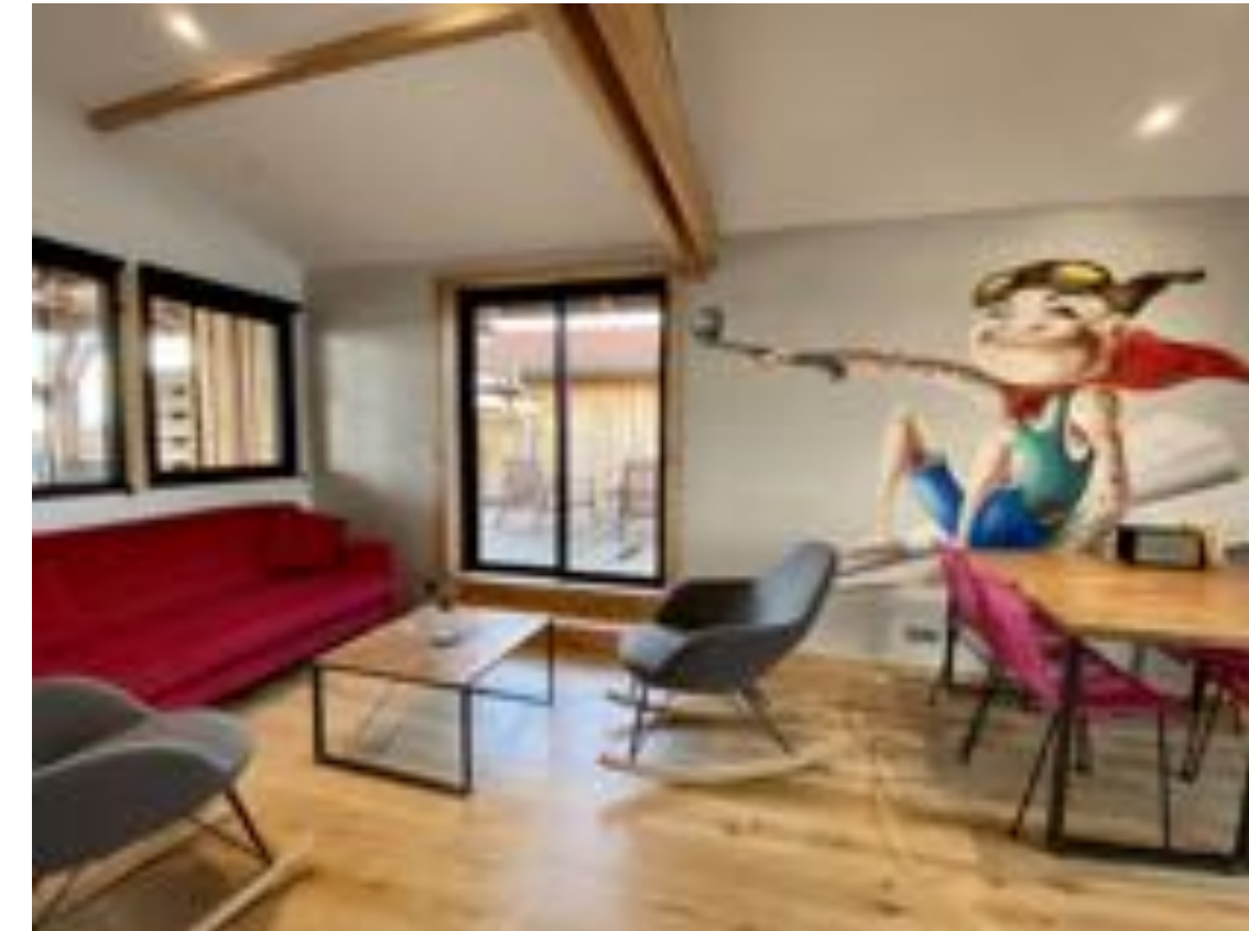
N°11 - J'ai 10 ans - MÖKA 2-4 pers

Sud : Terrasse couverte privative vue plan d'eau ostréicole équipée de fauteuils Acapulco tressés.