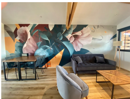
N°8 - L'Effet papillon par MIKA

Une mise en scène photographique à l'ambiance cinématographique, composée par l'artiste sur la thématique insufflée a donné lieu au traitement du mur tels deux tableaux. Un parti pris unique qui invite à contempler l'horizon.