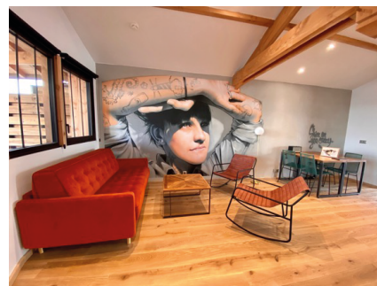
N°9 - Good morning bassin par JEAN ROOBLE

L'artiste a souhaité proposer une composition graphique avec un travail de teinte singulier et doux. La fresque invite au séjour au coeur d'un écrin naturel à préserver.