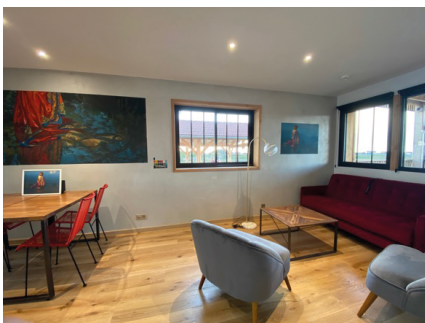
N°7 - Les Filles de l'aurore par ROUGE

Une mise en scène photographique à l'ambiance cinématographique, composée par l'artiste sur la thématique insufflée a donné lieu au traitement du mur tels deux tableaux. Un parti pris unique qui invite à contempler l'horizon.