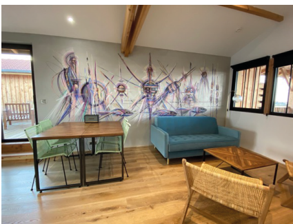
N°11 - J'ai 10 ans par MÖKA

L'artiste ayant lui même voyagé, propose une invitation au voyage intérieur. Au delà de la nature, il observe les connexions entre les hommes, la terre, le ciel et les espèces.